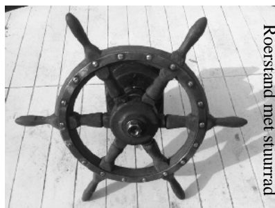
Roerstand met stuurrad

De werf wil nu zelf zorgen voor onderhoud en herstel van het casco zodat dat de boot weer veilig terug in het water kan.