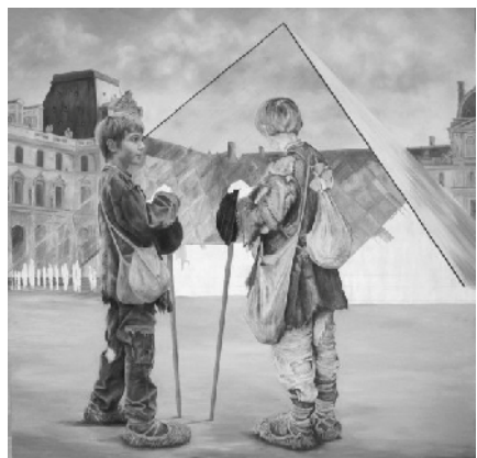
Schilderij in wording

Na een paar jaar gewerkt te hebben trad hij op zijn 22e in, in het klooster. Daar kon hij zijn grote passie, het schilderen, beeldhouwen en boekbinden verder ontwikkelen. In zijn, voor al deze kunstvormen ingerichte atelier bij het Kruisherenklooster waar hij sinds een jaar woont, val je van de ene verbazing in de andere. Prachtige schilderijen als zijn foto's, maar ook de portret- potloodtekeningen op doek zijn zo treffend.