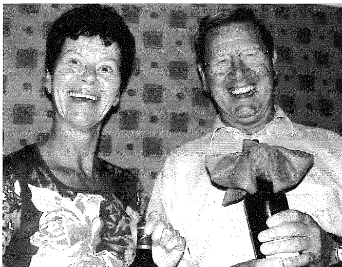
GESLAAGDE FEESTAVOND VAN DE OPA-CLUB