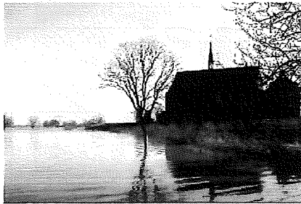
Het klooster bij hoogwater

de bibliotheek en de schilderijen. De kruisherer hadden dit al aan zien komen en ervoor gezorgd dat de kostbaarste bezittingen waren verdwenen voordat de Franse commissaris verscheen. Napoleon werd verslagen voor afloop van het contract en de Kruisherer bleven in St. Agatha.