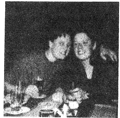
Even uitpuffen na de wedstrijd

Afgelopen zondag was het overvol in de sporthal van Oeffelt, waar na afloop van de wedstrijden zowel het eerste als het tweede seniorenteam als kampioen 'binnencompetitie' kon worden gehuldigd. En dan is er na alle inspanningen voldoende reden om te feesten.