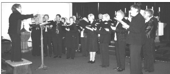
Het koor "De Maasklanken"

Dat zal beide koren er echter niet van weerhouden, om in de toekomst nog eens opnieuw samen wat op touw te zetten.