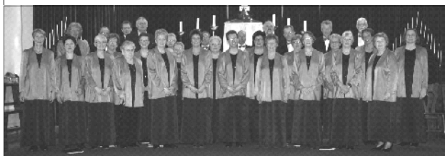
Het Cuijkse koor "Zang Veredeld"

Het optreden van het Cuijkse koor bestond uit twee delen. Als eerste werd er tijdens de eredienst van 09.30 de Deutsche Messe ten gehore gebracht.