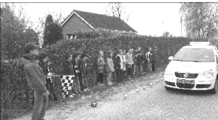
Voor de remproeven werd de weg afgesloten en stonden de leerlingen op de pedalen

Hallo auto leerde de kinderen van de middenbouw op de speciaal afgezette Groeneweg over de remweg van een auto en de invloed van reactiesnelheid op die remweg. Kinderen namen zelf plaats op de bijrijderstoel van een ANWB rijlesauto en mochten zelf remmen. Ook het belang van het dragen van een gordel kwam in deze les aan bod.