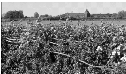
De gevlochten maasheg langs een wei

Het is al weer negen jaar geleden dat het door de uiterwaarden slingerend Laarzenpad geopend is. Afgaande op geplet of weggesleten gras, mag je er van uit gaan dat het een veelvuldig gelopen rondje is. Vanmorgen (30 apr.) nog was de redactie er getuige van dat vier bepakte en bezakte dames uit Arnhem voor deze route kozen.