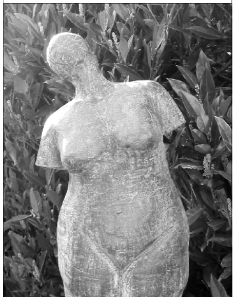
Hierboven een afbeelding van een van de te bewonderen creaties in de Beeldentuin aan de Liesmortel

De Beeldentuin is gratis te bezoeken op 13, 17, 19 en 20 mei van 11.00 tot 17.00 uur.