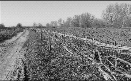
Gevlochten heggen geven weer een ruime blik

Zondag 9 maart in Beugen: NK Maasheggenvlechten Zondag 9 maart is er weer een Nationaal Kampioenschap Maasheggenvlechten. Vorig jaar kwamen 7000 bezoekers af op dit evenement, en iedereen was enthousiast. De Stichting Heg en Landschap organiseert dit evenement in samenwerking met de gemeente Boxmeer, Staatsbosbeheer en IVN de Maasvallei.