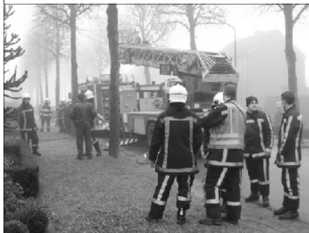
't zekere voor 't onzekere nemen, uitrukken met groot materieel!

Aan de Liesmortel was in 'n slaapkamer fikse rookontwikkeling gemeld. Bij inspectie door de spuitgasten, bleek een kachelkje de inrichting van deze kamer aan het smeulen gebracht te hebben. Gelukkig werd het gevaar snel ingedamd zodat de gevolgen uiteindelijk meevallen maar toch, het zal je maar overkomen, zo vlak voor de feestdagen.