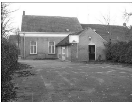
De ruimte achter het Staaasje waar de jongeren ontmoetingsplaats ingericht zal worden.

Vanuit het dorpsontwikkelingsplan is naar voren gekomen dat er in St. Agatha behoefte bestaat voor een zogenaamde JOP; jongeren ontmoetingsplaats.