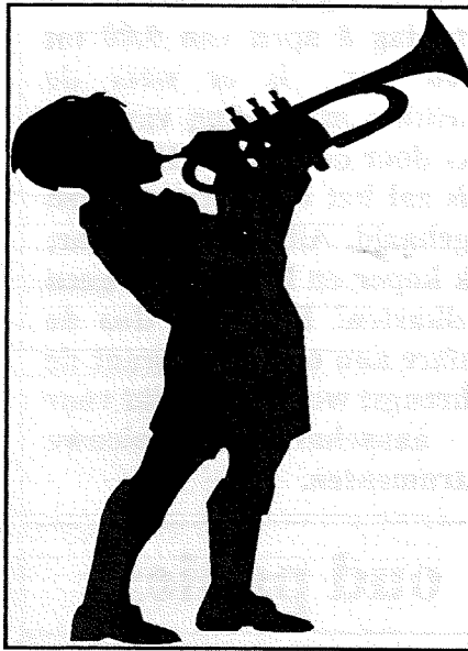
De fanfare H. Agatha telt op dit moment vijftig enthousiaste leden