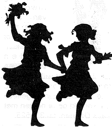
Het Staagje van St. Agatha als een ontmoetingsplaats voor de jongeren van ons dorp.