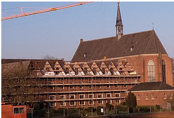
Het complete dak eraf voor nieuwe isolatie en dakpannen

Het afgelopen jaar is er flink verbouwd in het klooster. De kloostercellen in het woongedeelte van het complex zijn vervangen door 12 moderne, zelfstandige appartementen met eigen keukens en sanitair. Ze gaan bewoond worden door de Kruisheren en door mensen die zich verbonden voelen met de traditie van het klooster.