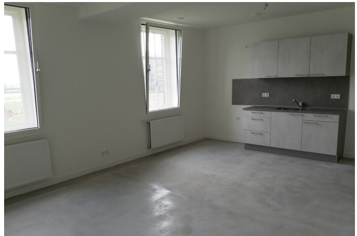
Het eindresultaat appartement eerste verdieping

Met de verbouwing heeft het klooster de woonfunctie willen aanpassen aan de maatstaven van deze tijd. Daarmee is een belangrijke basis gelegd voor een duurzame exploitatie van dit bijzondere gebouw de komende decennia. Op 27 oktober zijn de appartementen officieel opgeleverd en momenteel trekken de bewoners erin.