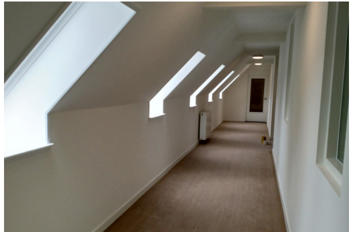
Het eindresultaat pandgang van de zolder

Met de verbouwing heeft het klooster de woonfunctie willen aanpassen aan de maatstaven van deze tijd. Daarmee is een belangrijke basis gelegd voor een duurzame exploitatie van dit bijzondere gebouw de komende decennia. Op 27 oktober zijn de appartementen officieel opgeleverd en momenteel trekken de bewoners erin.