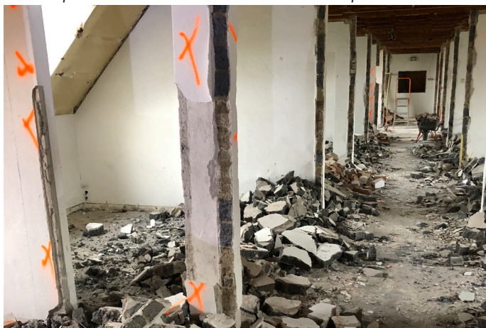
Samenvoegen van de kloostercellen